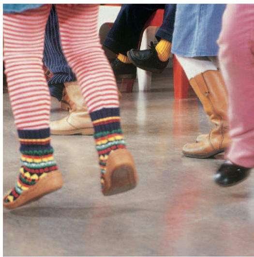
Траен, предпазва от драскотини.